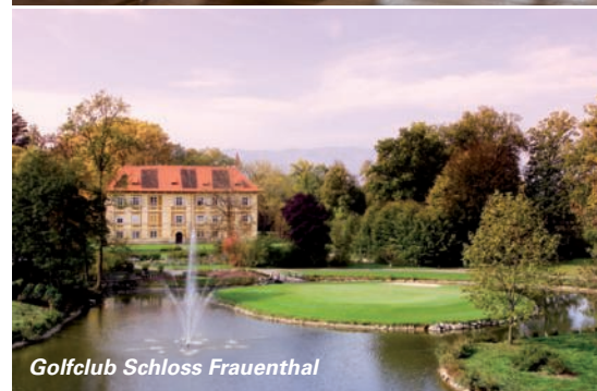
Golfclub Schloss Frauenthal